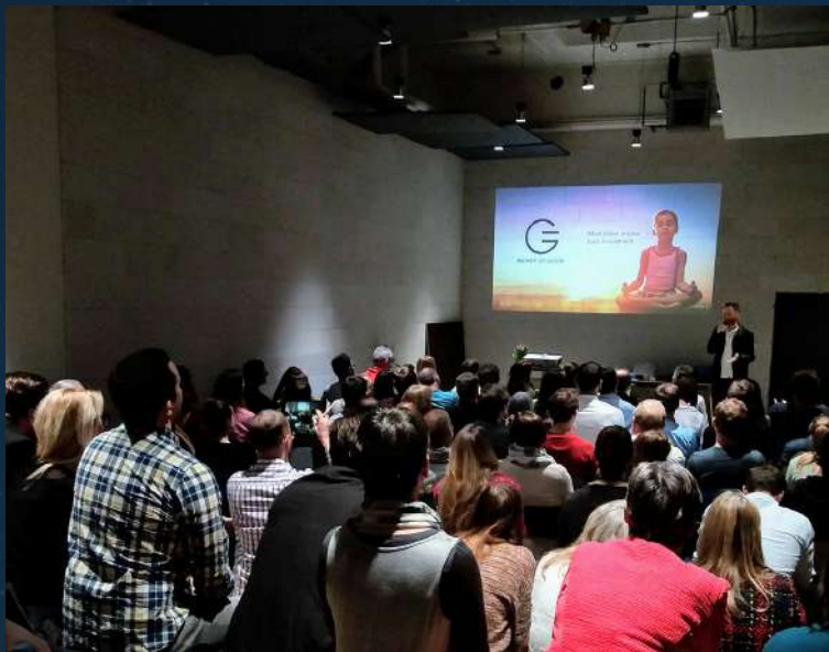
Palestra na Mindful Conference no Impact Hub de Munique 04.2019